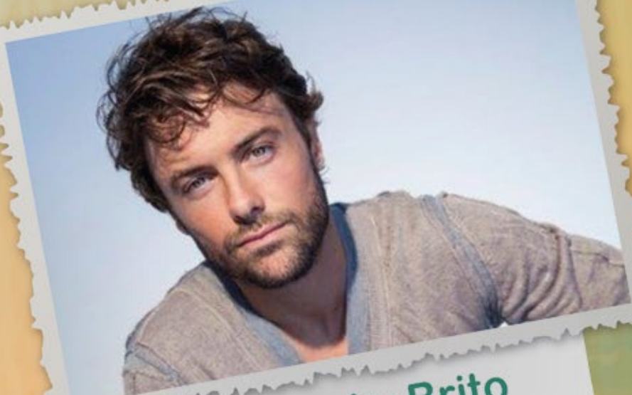
Kayky Brito Ator

Iniciou sua carreira atuando em campanhas publicitárias, em 1997. Estreia como ator no espetáculo musical "Marcelo Marmelo Martelo", de Ruth Rocha, em 1998. Em 1999, faz seu primeiro papel na televisão, na novela Chiquititas, no SBT. Em 2002, transfere-se para a Rede Globo, onde protagoniza a novela "O Beijo do Vampiro".