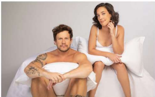
O Dia Seguinte

O Dia Seguinte adapta crônica Luis Fernando Verissimo para teatro e passa por Vitória no sábado (18) e domingo (19). Confira programação de novembro